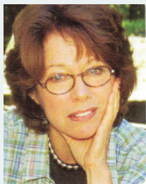
Dr. med. Marianne Koch Präsidentin der Deutschen Schmerzliga e. V.